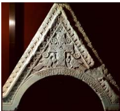
Слика 1: забат из Уздоља код Книна