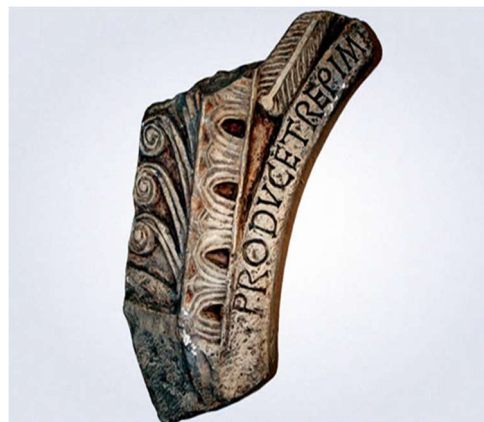
Слика 2: фрагмент из Рижиница